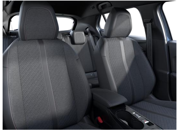
LOMSA szövetkárpit 'quartz' díszvarrással Allure széria