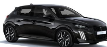
Perla Nera fekete