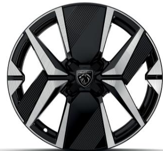
17" YANAKA GT széria