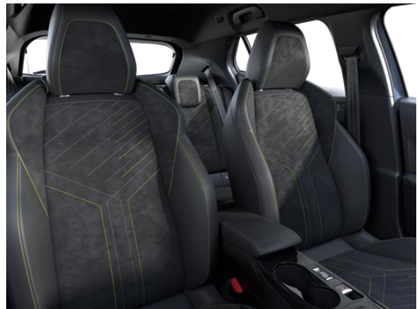
Alcantara ICONIUM kárpit 'adamite' díszvarrással GT opció