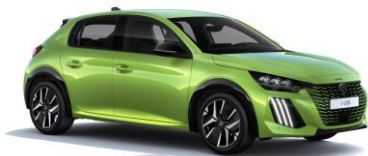
Agueda sárga- széria