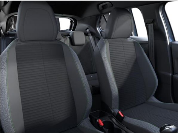
PNEUMA 3D szövetkárpit 'calcite' díszvarrással Active széria