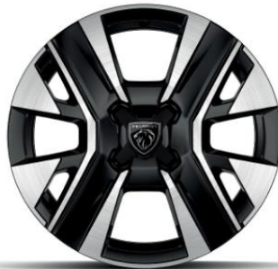
16" NOMA Allure széria