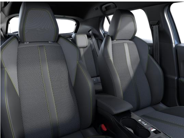
BELOMKA bőr-szövetkárpit 'adamite' díszvarrással GT széria