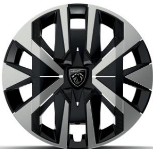
16"-os acél MONTI dísztárcsával Active széria