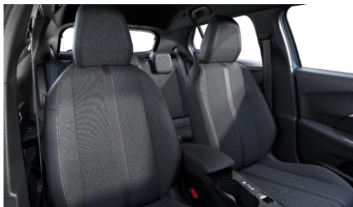
LOMSA szövetkárpit 'quartz' díszvarrással Allure széria