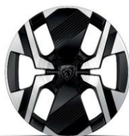
17" KARAKOY Allure, GT széria