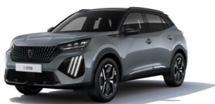
Selenium szürke - széria