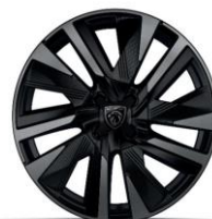
18" EVISSA GT opció