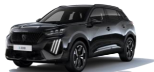
Perla Nera fekete